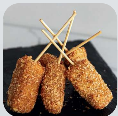
KUSHIAGE DE QUESO