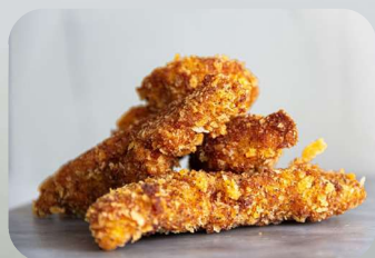
TIRAS DE POLLO- EMPANIZADO - $95

5 Tiras de Pechuga de Pollo con Empanizado Mandarina