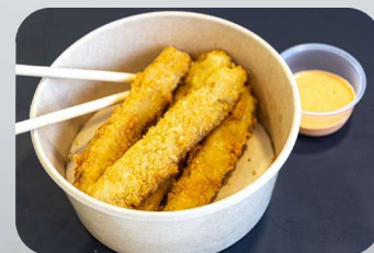
TIRAS DE PESCADO - EMPANIZADO $90

5 Tiras de Pescado con Empanizado Mandarina